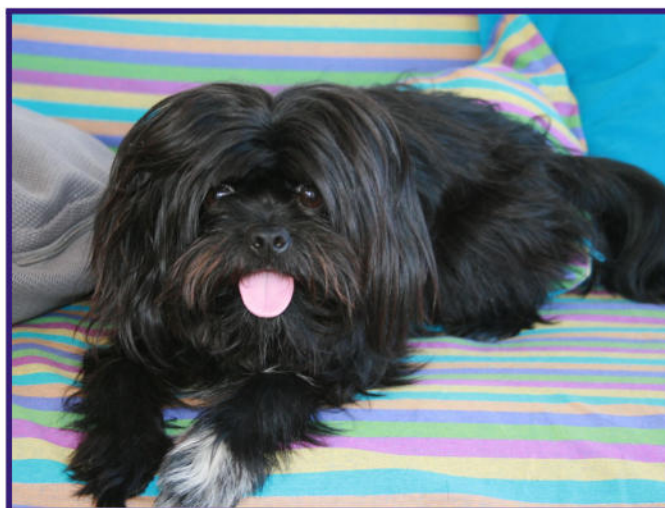
Dedicat al meu millor amic