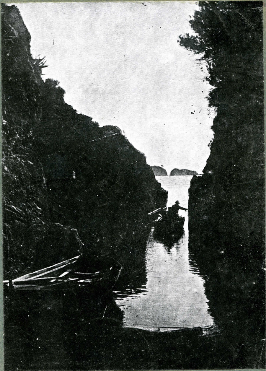
Gliré de Joan B. Camós