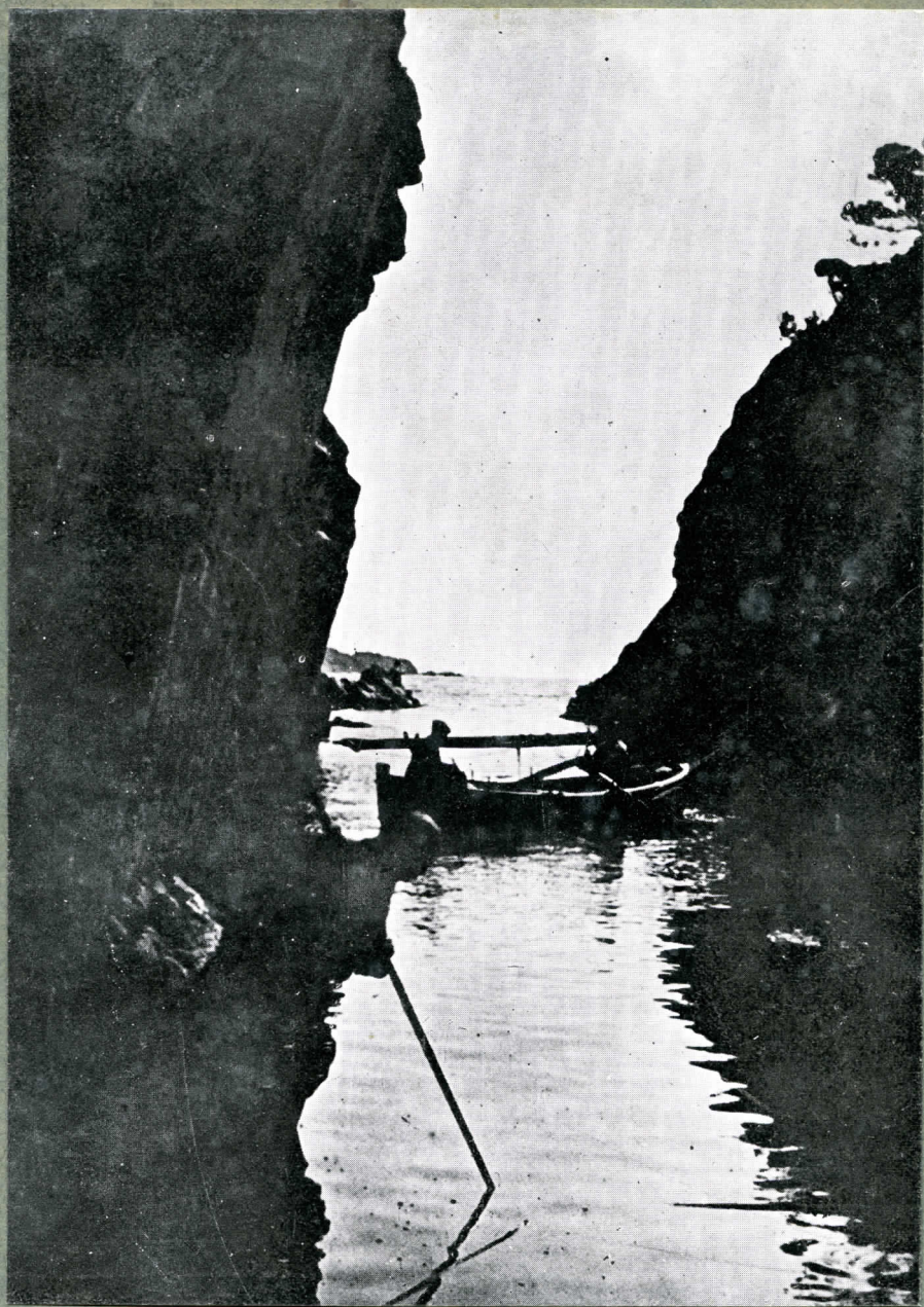
Clot de Joan B. Camis