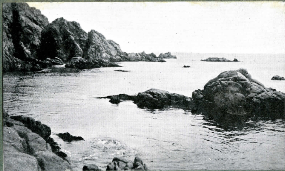
Els esculls (sota les piles)